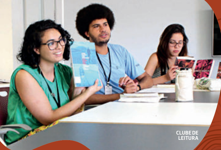
CLUBE DE LEITURA